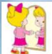
Отражение в зеркале

Он - ваш портрет, Во всем на вас похожий. Смеетесь вы - Он засмеется тоже. Вы скачете - Он вам навстречу скачет. Заплачете - Он вместе с вами плачет.