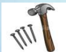
Молоток и гвоздь

Самый бойкий я рабочий В мастерской. Колочу я что есть мочи День-деньской. Как завижу лежебоку, Что валяется без проку, Я прижму его к доске Да как стукну по башке! В доску спрячется бедняжка - Чуть видна его фуражка.