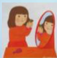
Отражение в зеркале

Друг на друга мы похожи. Если ты мне строишь рожи, Я гримасничаю тоже.